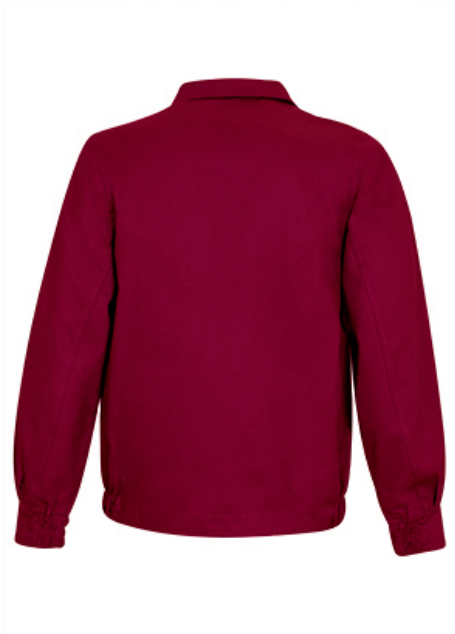
Vista parte trasera de la prenda (espalda)