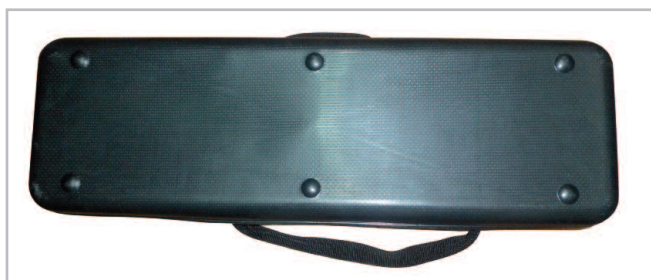
Base rígida inferior