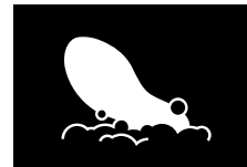
PLANTILLAS EXTRAÍBLES LAVABLES