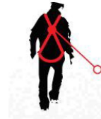
Caduta FATTORE 2 il punto di ancoraggio è situato sotto il punto di ancoraggio dorsale dell'imbracatura