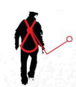
Fall FACTOR 1

anchor point located at the same level of the back anchor point of the harness