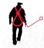
Caduta FATTORE 1 punto di ancoraggio situato sullo stesso livello del punto di ancoraggio dorsale dell'imbracatura