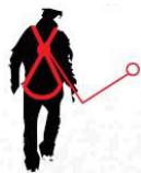
Queda FATOR 1 ponto de ancoragem situado ao mesmo nível do ponto de ancoragem