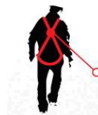
Queda FATOR 2 ponto de ancoragem situado a baixo da conexão dorsal do arnês