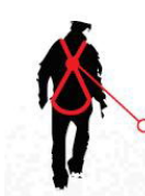
Fall FACTOR 2

anchor point located at the same level of the back anchor point of the harness