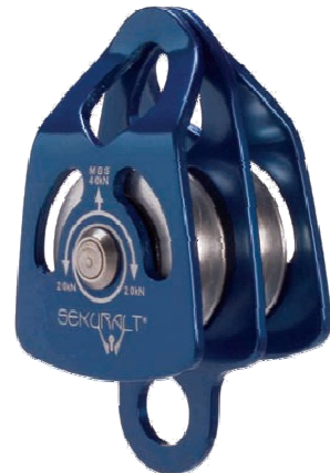
RP064 / RP067