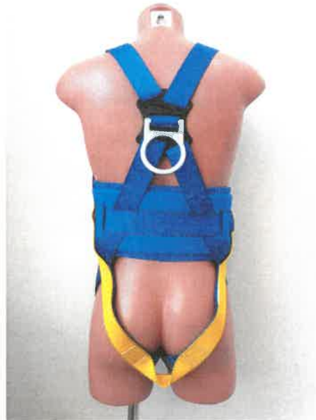
Bezpečnostní postroj / Full body harness, typ / type AB17811SM