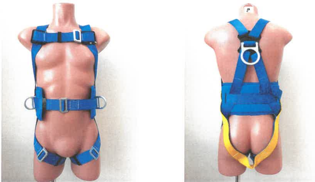
Bezpečnostní postroj / Full body harness, typ / type AB17611SM