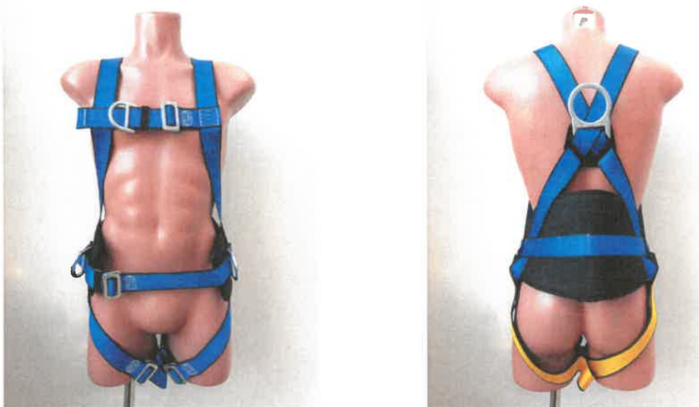
Bezpečnostní postroj / Full body harness, typ / type 1310110