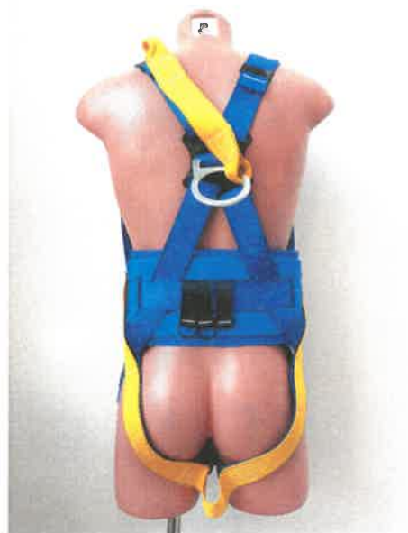
Bezpečnostní postroj / Full body harness, typ / type AB17820UNI