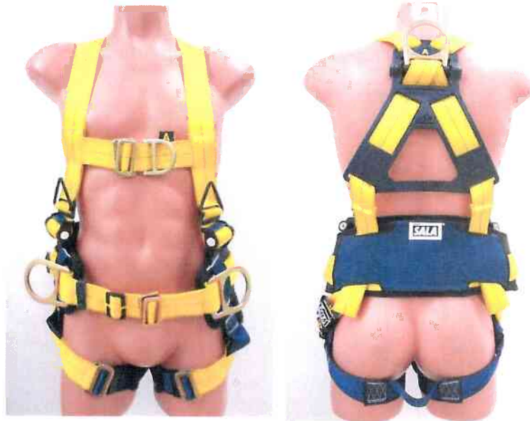
Typ / Type 1112906