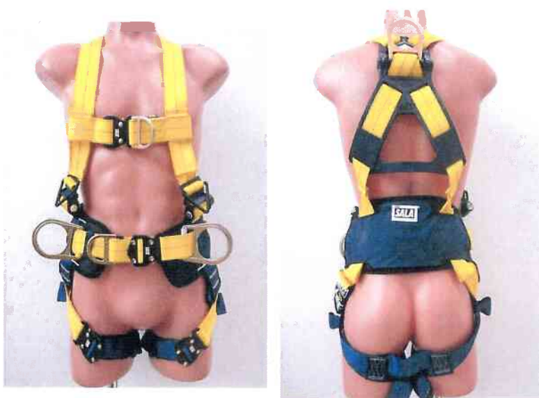
Typ / Type 1112925