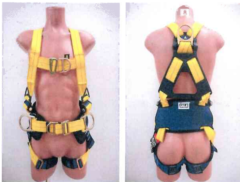
Typ / Type 1112921