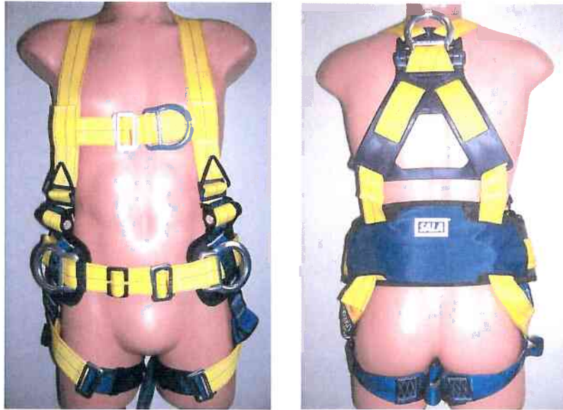
Typ / Type 1112939