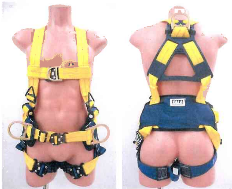
Typ / Type 1112909