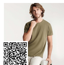
DOGO PREMIUM CA6502