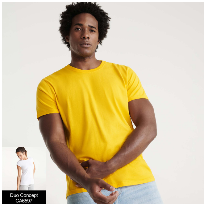
Duo Concept CA6597