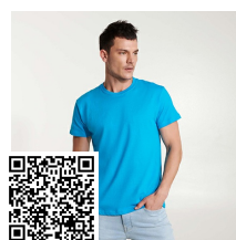
ATOMIC 150 CA6424