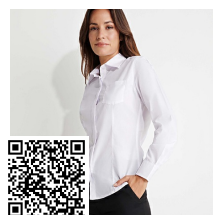
SOFIA L/S CM5161