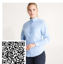
OXFORD WOMAN CM5068