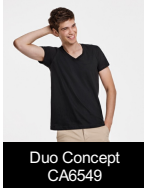
Duo Concept CA6549