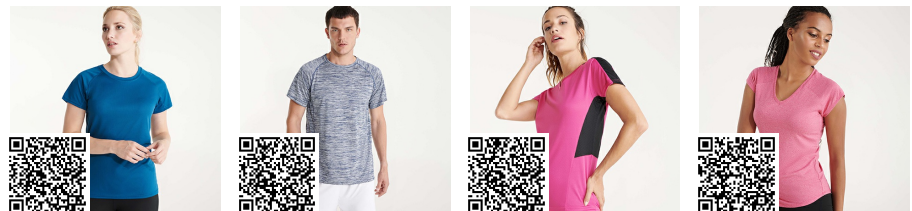
BAHRAIN WOMAN CA0408