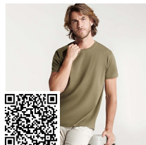
DOGO PREMIUM CA6502