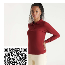
ESTRELLA WOMAN L/S PO6636