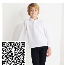
CARPE CHILD PO5008