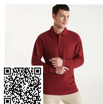
ESTRELLA L/S PO6635