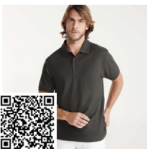
PEGASO PREMIUM PO6609