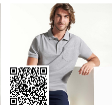
CENTAURU PREMIUM PO6607