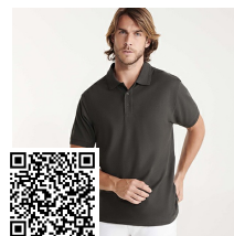
PEGASO PREMIUM PO6609