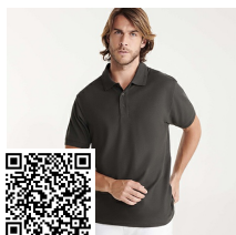
PEGASO PREMIUM PO6609