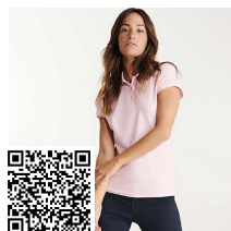
STAR WOMAN PO6634