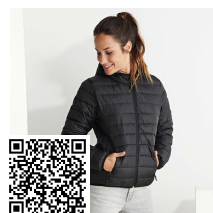
NORWAY WOMAN RA5091