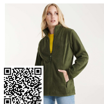
ARTIC WOMAN CQ6413