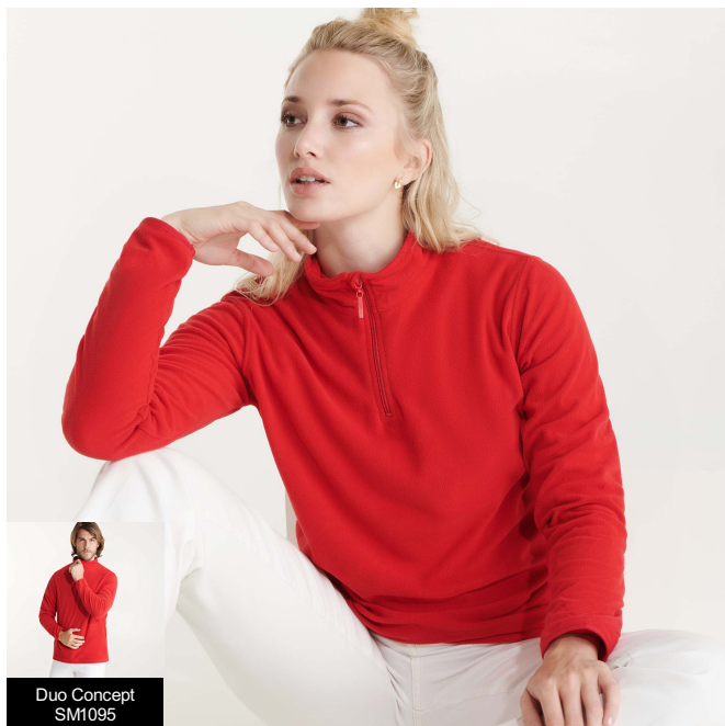
Duo Concept SM1095