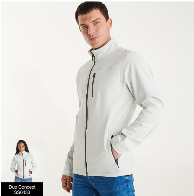
Duo Concept SS6433