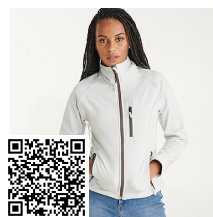
ANTARTIDA WOMAN SS6433