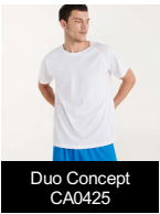
Dúo Concept CA0425