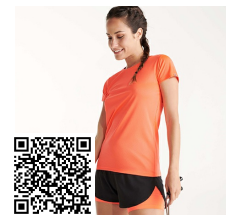
IMOLA WOMAN CA0428