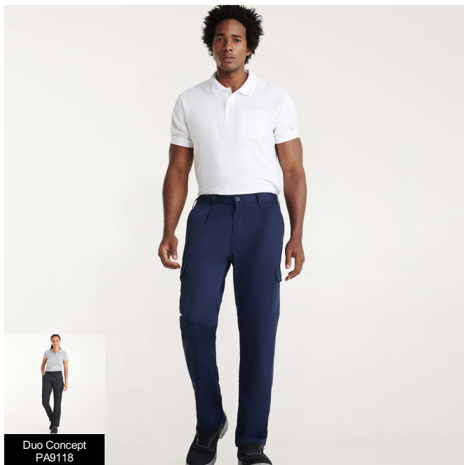
Duo Concept PA9118