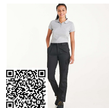
DAILY WOMAN PA9118