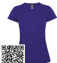
MONTECARLO WOMAN CA0423