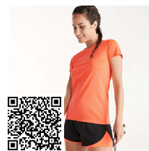
IMOLA WOMAN CA0428