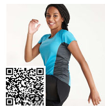
SHANGHAI WOMAN CA6648