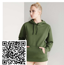
URBAN WOMAN SU1068