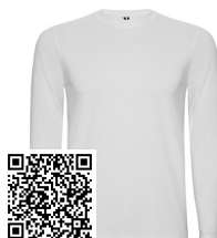
SOUL L/S R12510