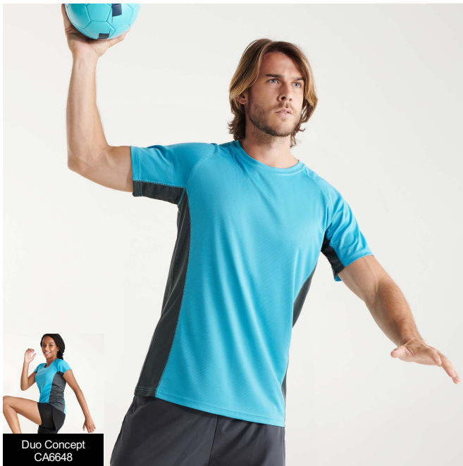
Duo Concept CA6648