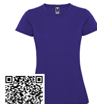
MONTECARLO WOMAN CA0423