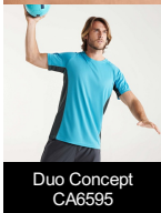
Duo Concept CA6595