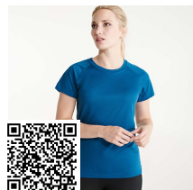
BAHRAIN WOMAN CA0408