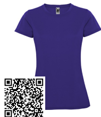
MONTECARLO WOMAN CA0423