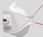
Mascarilla con válvula 3M™ Aura™ 9332+