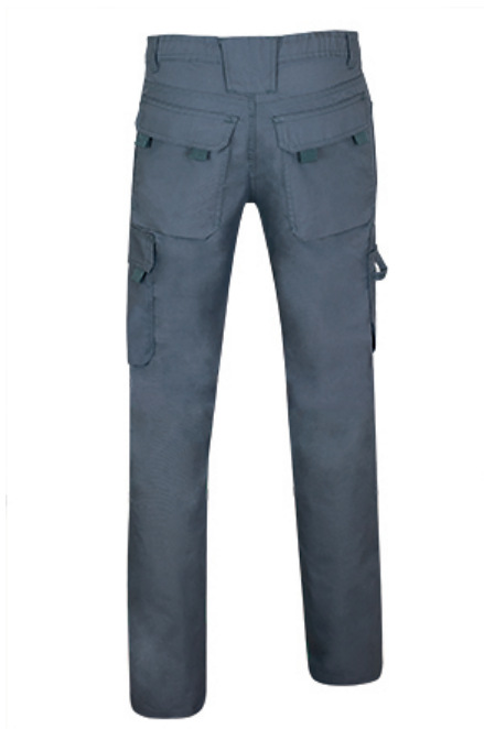
Vista parte trasera de la prenda