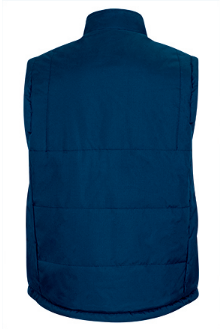
Vista parte trasera de la prenda (espalda)