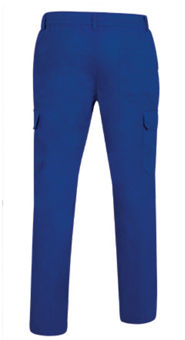
Vista parte trasera de la prenda