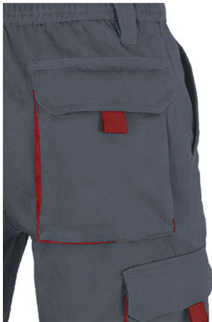
Detalle bolsillo lateral