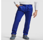
Duo Concept PA9100